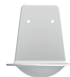
Coupelle stop gouttes (AC0170)