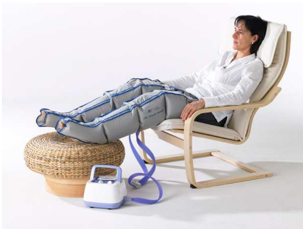
Livré avec deux bottes de pressothérapie, deux extensions de bottes, un tubulaire, l'appareil et un mode d'emploi.